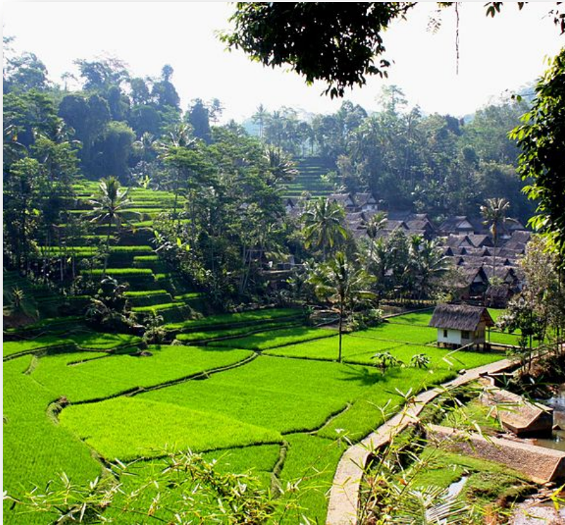
Cụm dân cư (Kampung) Naga phía tây tỉnh Java Indonesia